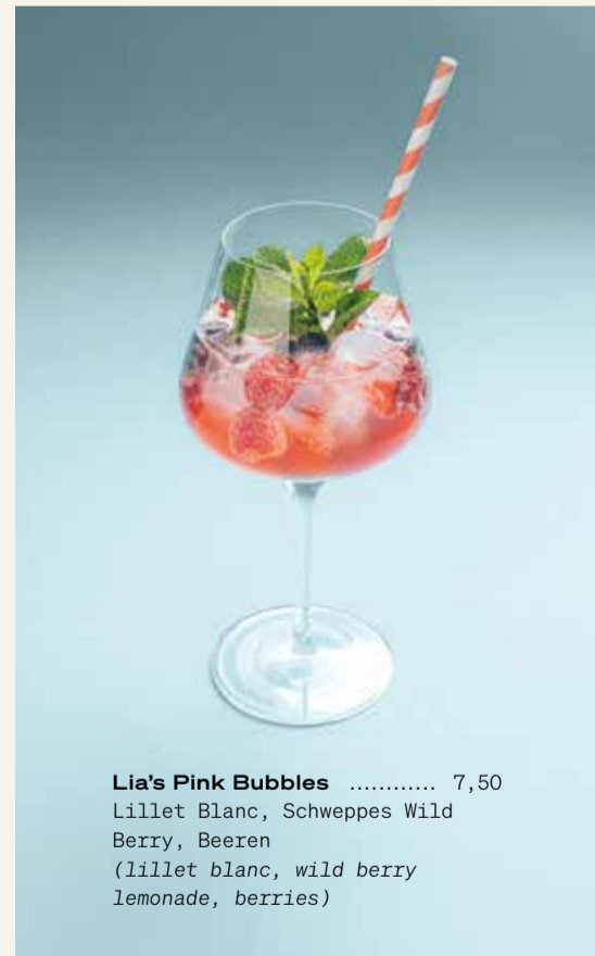
Lia's Pink Bubbles ..... 7,50 Lillet Blanc, Schweppes Wild Berry, Beeren (lillet blanc, wild berry lemonade, berries)

Jameson Whiskey ..... 2 cl ..... 4,50 Havana Club Rum ..... 2 cl ..... 4,50 Tanqueray Gin ..... 2 cl ..... 4,50 Absolut Vodka ..... 2 cl ..... 4,50 Jägermeister ..... 2 cl ..... 3,80 Averna ..... 2 cl ..... 4,20 Nonino Grappa ..... 2 cl ..... 4,60 Marillenbrand ..... 2 cl ..... 4,60 Williams Birne ..... 2 cl ..... 4,60